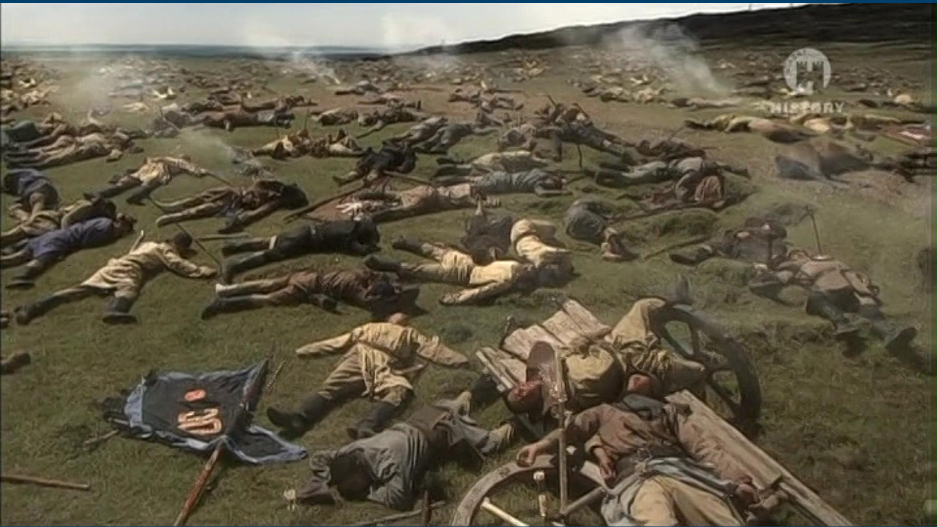
Поле бою після битви на р.Калці